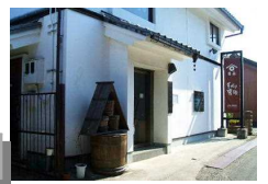
写真(左下、右下)は、前回ツアーの様子