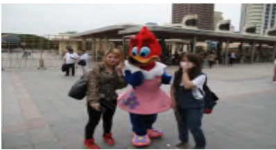
ウイニーと一緒に「ハイポーズ」

5月24日(水)季節はずれの暑さが和らぎ、気持ちの良い遠足日和となりました。生徒たちが楽しみにしていたUSJです。それぞれが思い思いのアトラクションを楽しみ、帰りのバスでは美味しいハンバーガーをいただきました。