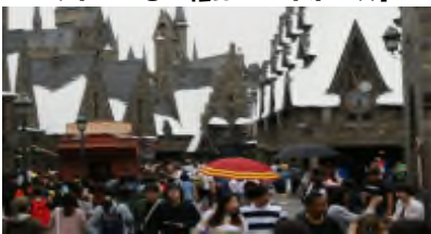
ハリポットのエリア!