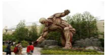
等身大の「鉄の巨人」