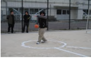
ハンドボール投げ

5月15日(月)恒例のスポーツテストを実施。皆、どの種目にも真剣に取り組み、いい汗を流していました。生徒たちの清々しい表情がとても印象的でした。