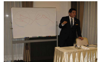
ナイフとフォークは?