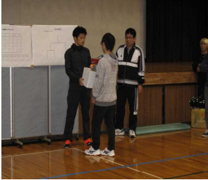
対戦相手は誰かな?

10月23日(月)校内球技大会で真剣勝負をしました。体育の授業と違って、今日は本番、いわば公式戦です。勝負にこだわることで、気持ちが強くなります。優勝賞品はQUOカードでした!