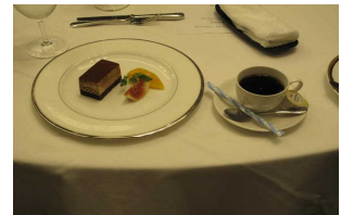
最後はデザートとコーヒーで