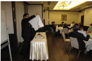
ナフキンはこうですよ

10月26日(木)、和歌山市のホテルアバロームでテーブルマナー教室を開催、フランス料理のフルコースをいただきながら、マナーについて、わかりやすく丁寧に教えてもらいました。美味しい料理に、お腹も心も大満足、ごちそうさまでした!