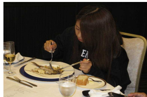
うーん、魚はむぎかしい!