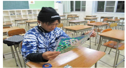
どんな絵ができるのかな?

そして、10月23日(火)、ピースを一人ずつ貼り合わせ、モザイクアートが完成しました。