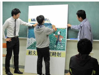
絵が見えてきました。