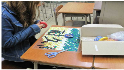
テープを切りながらの作業です。