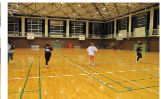
シャトルランでへばりました