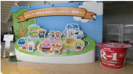
明治なるほどファクトリー関西に到着!

5月17日(金)、新入生歓迎会として、「明治なるほどファクトリー関西」で工場見学、「二色の浜海水浴場」で潮干狩りを行いました。工場見学ではヨーグルトを製造する様子を見学した後、ヨーグルトの歴史やヨーグルトに含まれている乳酸菌について説明を受けました。また、潮干狩りでは、学年対抗で、とれた貝の数を競い、楽しい時間を過ごしました。