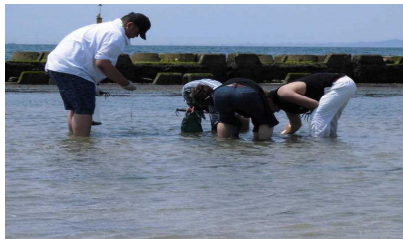
見よ!このチームワークを!