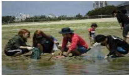
今日の晩御飯はあさりのパスタ!