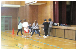
体がたくなってない?

5月21日(火) スポーツテスト8種目を実施。運動する機会が少ない生徒達ですが、みんな真剣に取り組んでいました。やはり体を動かすことは楽しいようです。明日の筋肉痛が心配です。