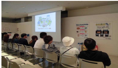
ヨーグルトについての説明を受けました。