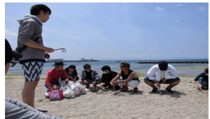
潮干狩り さあやるぞ!