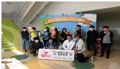
記念にハイポーズ、パチリ