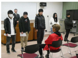
終業式前に行われた和定通研究生徒作品展示会表彰の様子

12月24日(火) 終業式。校長先生は、式辞で「人間は集中しているといい仕事ができ達成感を感じる。達成感があるとさらに意欲につながる。疲れは、振り返ったときに感じるもの。何かに取り組むとき集中力を維持し、飽きないようにするには、毎日ここまでやるなど、目標と期限を決め、少しずつ達成していくことが大切である。冬休み中、健康に留意し、集中力を高め、それぞれの目標を持って過ごしてください。」と述べられました。