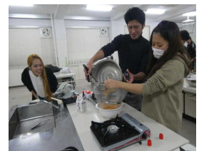
デザートもあるよ