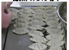
力をあわせてできた餃子です。心も体もあったまろ~