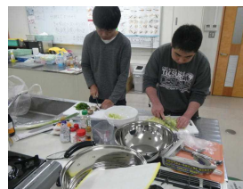
見よ、このテクニック!