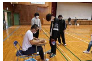
これはかなり出るぞ!