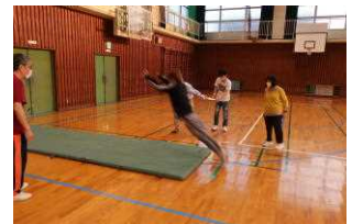
跳ぶぞ、ソォリャー!