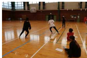
そう、リズムが大事!