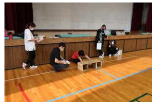
結構押せてますね!