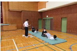
フン・フン・楽勝!!