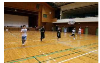
段々速くなってきた!