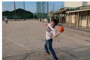
よし、あとここまで!