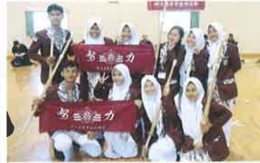
高校生サミット・クラブ交流