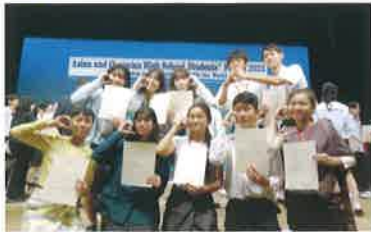
アジア・オセアニア高校生フォーラム