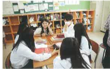
台湾学生との交流